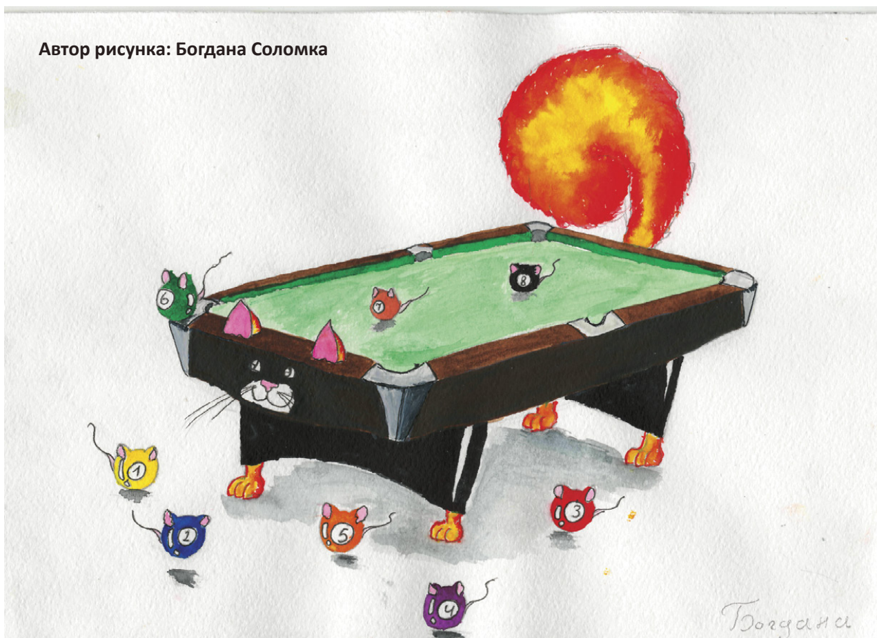
Автор рисунка: Богдана Соломка